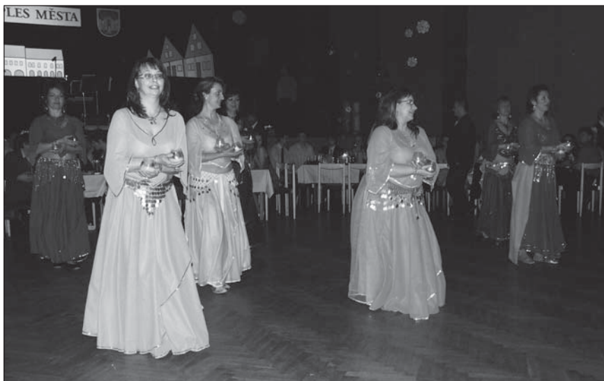
☐ Orientální tanečnice Pouštní růže.