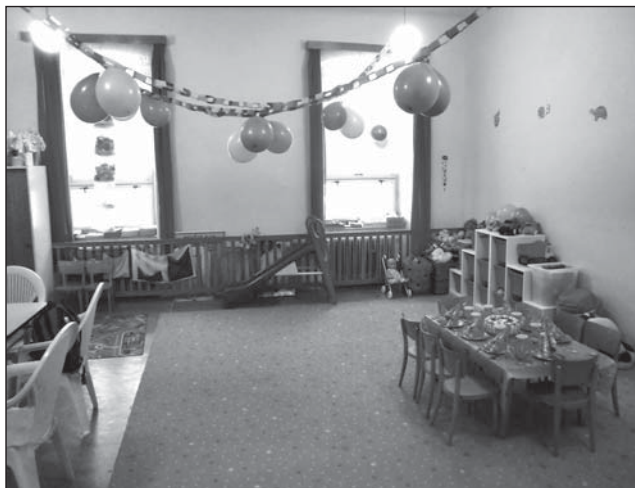
Prostory Mateřského centra Rampušáček.