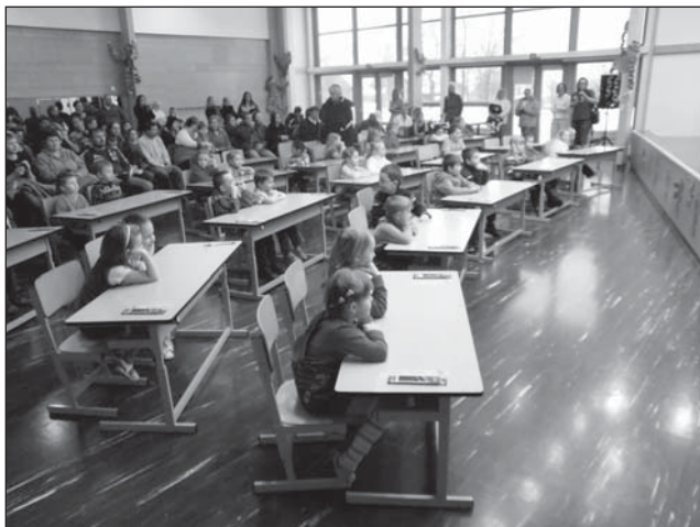
Slavnostní zápis do 1. ročníku Základní školy v Rokytnici v Orlických horách.

Zápis do 1. třídy je v Orlickém Záhoří vždy velkou a důležitou událostí. 10. února 2010 se k zápisu dostavili čtyři šikovní předškoláci společně se svými rodiči. Ti svá dítky fotili, filmovali a hlavně jim drželi palce. Na budoucí prvňáčky se ve škole těšíme již nyní.