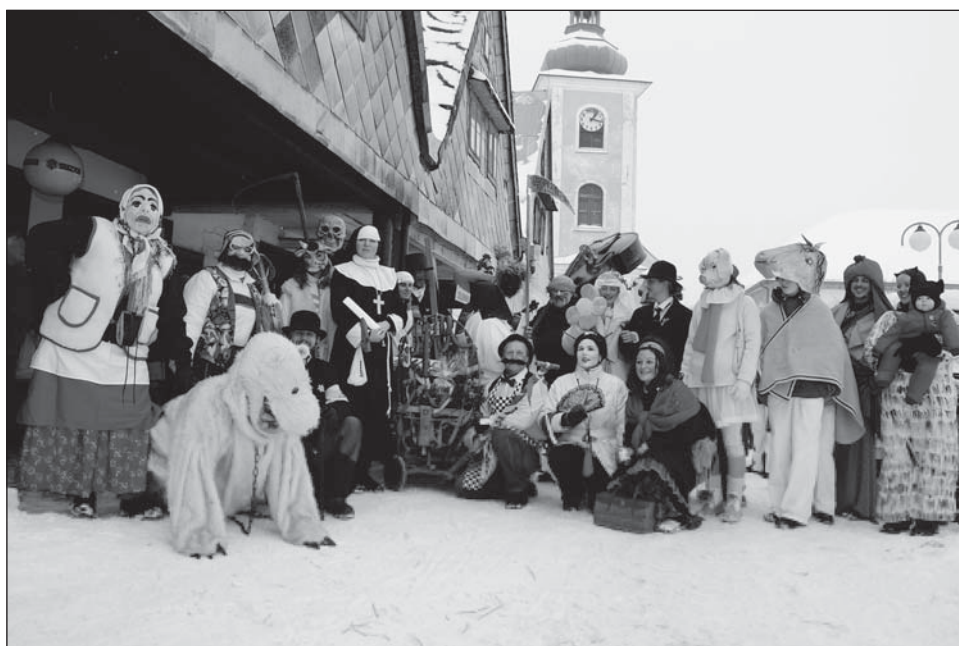
Masopustní maskary na rokytnickém náměstí.

Nápad oživit v Rokytnici masopust se překvapivě setkal s velkým zájmem rokytnických. A tak se 13. února 2010 dočkal znovuzrození opravdu ve velkém stylu. Nápaditý a veselý průvod masek, spoustu lidí v ulicích i na náměstí,