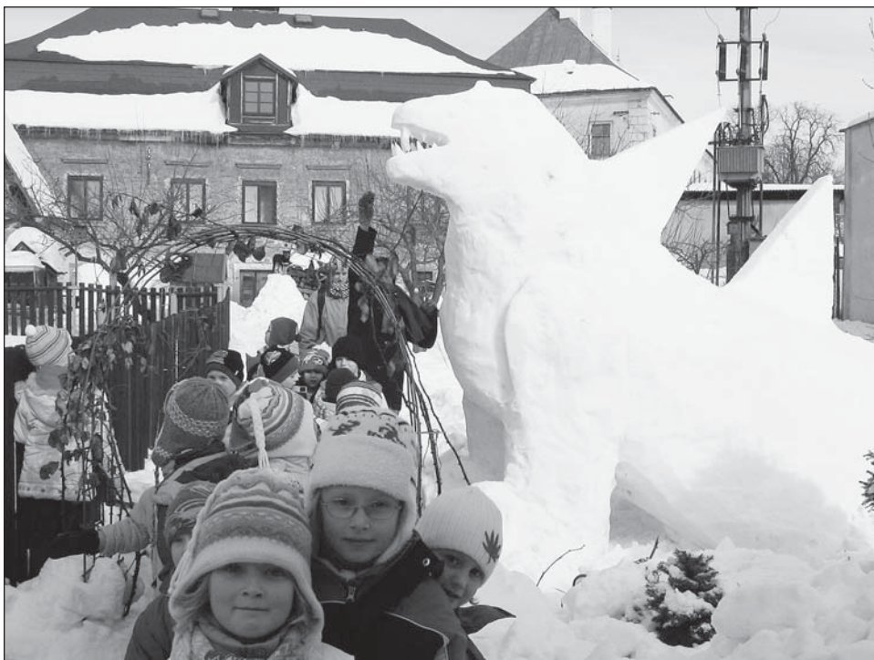
☐ Děti z mateřské školy na návštěvě v rokytnickém „dinoparku“.