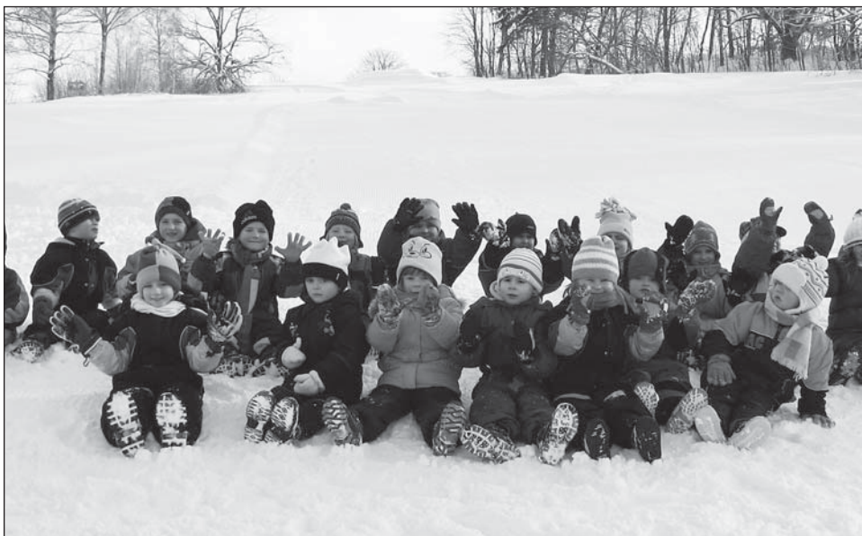
☐ Děti z rokytnické školky si užívaly zimní radovánky pod Farským kopcem.