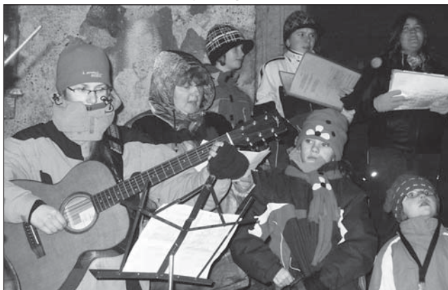
☐ Sbořeček žáků a zaměstnanců ZŠ Rokytice zpívají koledy na nádvoří rokytnického zámku.