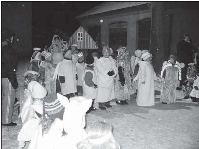
Andílky se to jen hemžilo.