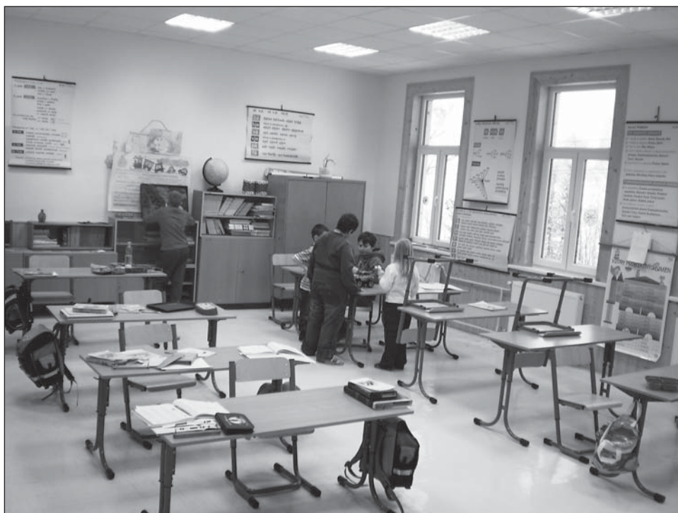
❑ V této třídě se učí děti od první až do páté třídy.

Taková školička může dnes existovat jen tehdy, když si obec uvědomuje význam její existence a dokáže se postarat o to, aby byl po všech stránkách zajištěn její provoz. Jak