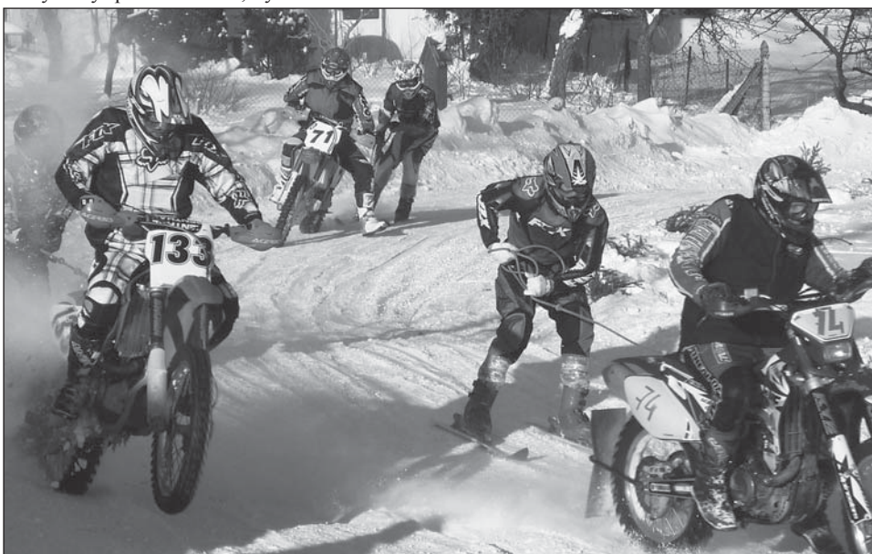
❑ Napínavý souboj jezdců a lyžařů při závodech v motoskijøringu na trati u nádraží v Rokytnici v Orlických horách.