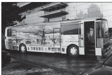
☐ Na provozu tohoto Infobusu - pojízdného informačního centra Orlických hor a Podorlicka - se podílí i město Rokytnice v Orlických horách.

Na této straně opět přinášíme komentovaný výběr z usnesení Rady města Rokytnice v Orlických horách. Jejich plné znění si můžete přečíst na internetových stránkách www.rokytnice.cz nebo jsou k dispozici na Městském úřadu. Tentokrát pro čtenáře přinášíme informace z jednání Rady města konaného dne 11. ledna 2010.