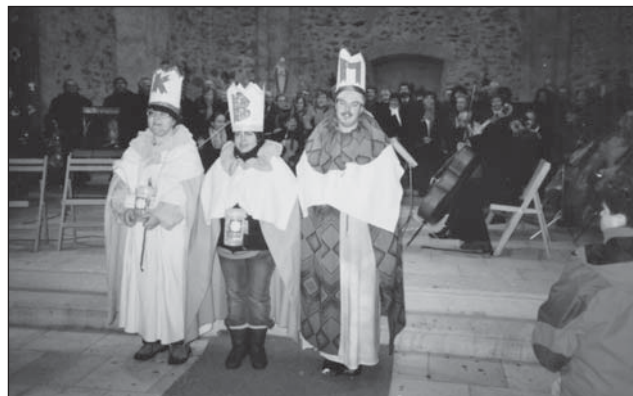
Tříkrálová sbírka v neratovském kostele.

Více o tradici Tří králů v Bartošovicích si můžete přečíst na www.e-kurýr.blog.cz