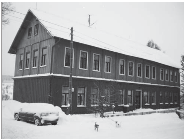
❑ Školní budova v Orlickém Záhoří byla postavena v roce 1882.