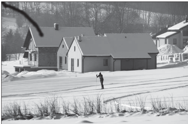
❑ Výstavba rodinných domků Na Pastvině za školou v Javornici.